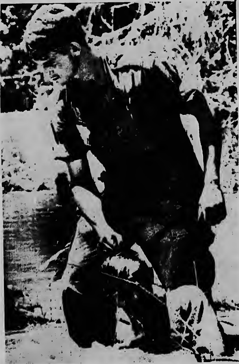
Un marinier di un unidad norteamericano aki ta sacando un solda di Viet Cong morto for di un rieuw na 12 milla di Da Nang. E comunista a muri durante "Operation Stone Two". Durante e operacion aki, nan a busca tunelnan cu equipo di Scuba Diving den e rieuw.